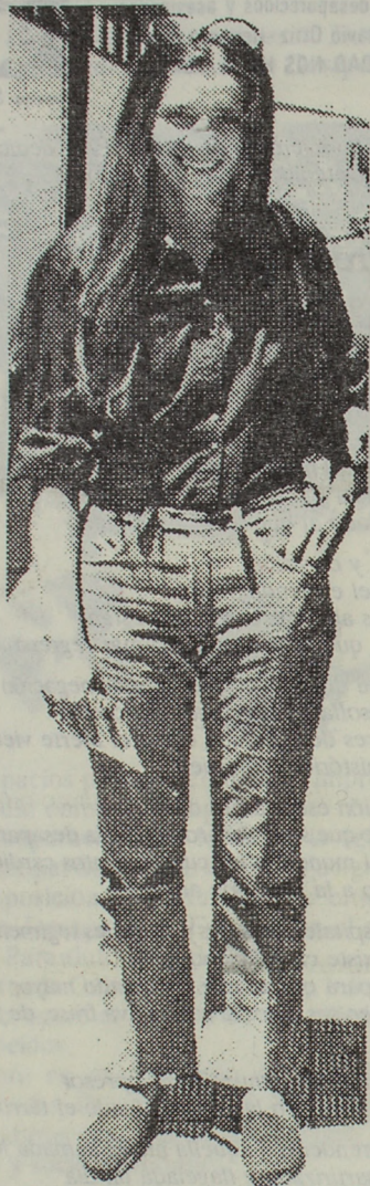
Palomita de los pueblos eres símbolo de paz te cantan voces valientes que quieren la libertad...

Soledad nació el 6 de enero de 1945 en el sur del Paraguay. Su nombre reflejaba la ausencia de nuestro padre, que ya en esa época era perseguido por sus ideas, como lo fué también su padre, nuestro abuelo, el escritor RAFAEL BARRETT.