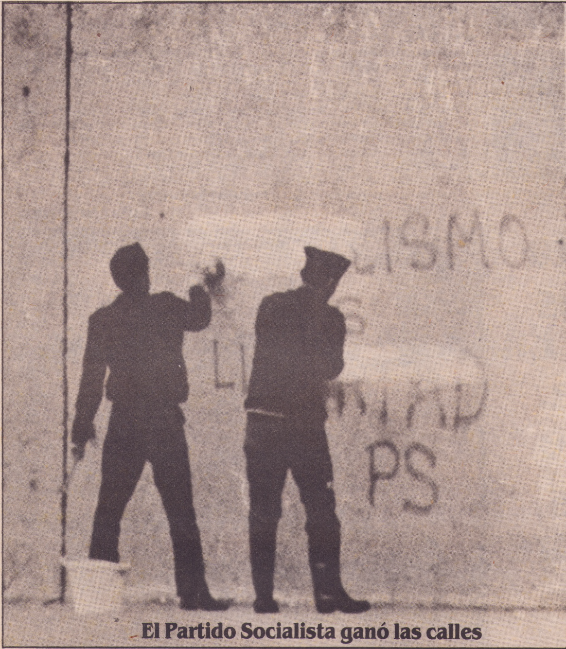
El Partido Socialista ganó las calles

E l Partido Socialista ha vuelto a ganar la calle. Volvió para derrotar definitivamente a la dictadura; para vencer tras la persecución, la cárcel, el exilio y la muerte de tantos compañeros. Como lo hizo una década y media atrás, luego de los años de proscripción decretados por el pachecato colorado, volvió para demostrar la certeza de sus ideas y desplegar ante todo su pueblo las banderas que con firmeza sostuvieron sus militantes durante estos once años, pese a la represión militar.