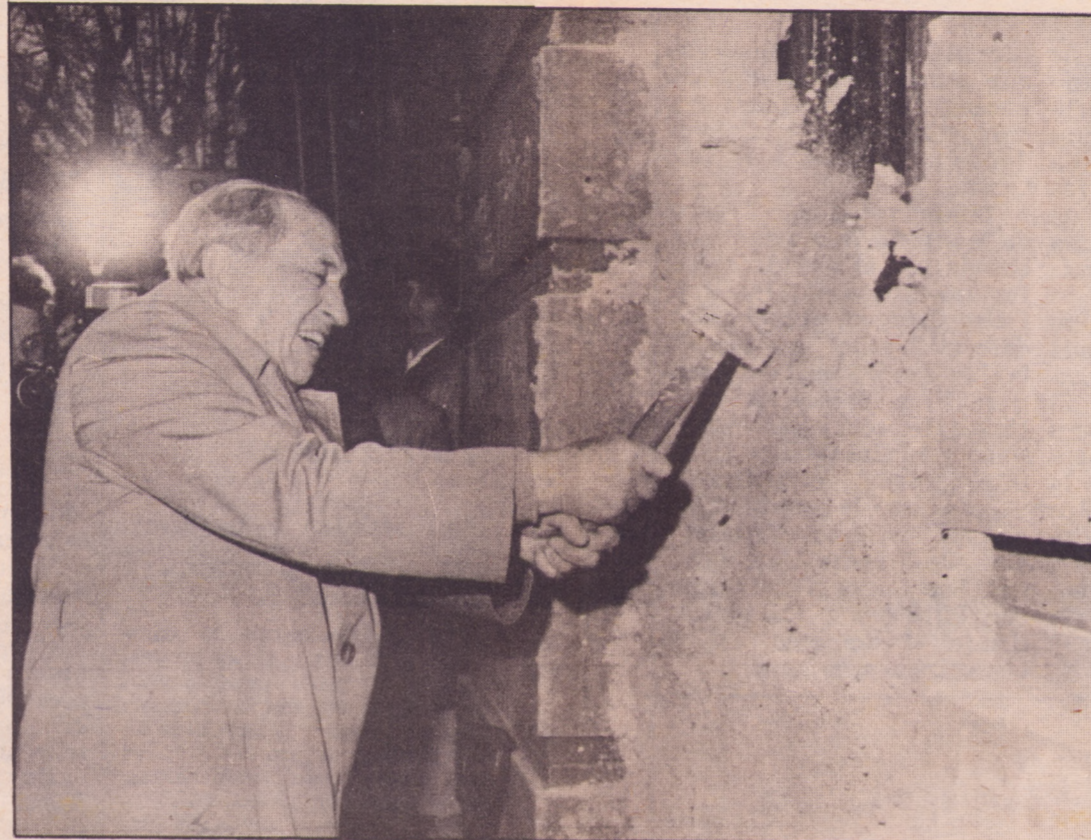
La dictadura había clausurado a cal y piedra la Casa del Pueblo. Con Cardoso hicimos fuerza todos.

Nuestro Partido siempre ha distinguido dos fases que constituyen, en rigor, un sólo proceso: la nacional-liberadora y la socialista. Pero la coyuntura presente, la de una na-