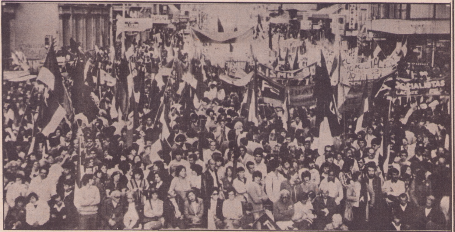
Acto de proclamar a candidatos Octubre de 1984.