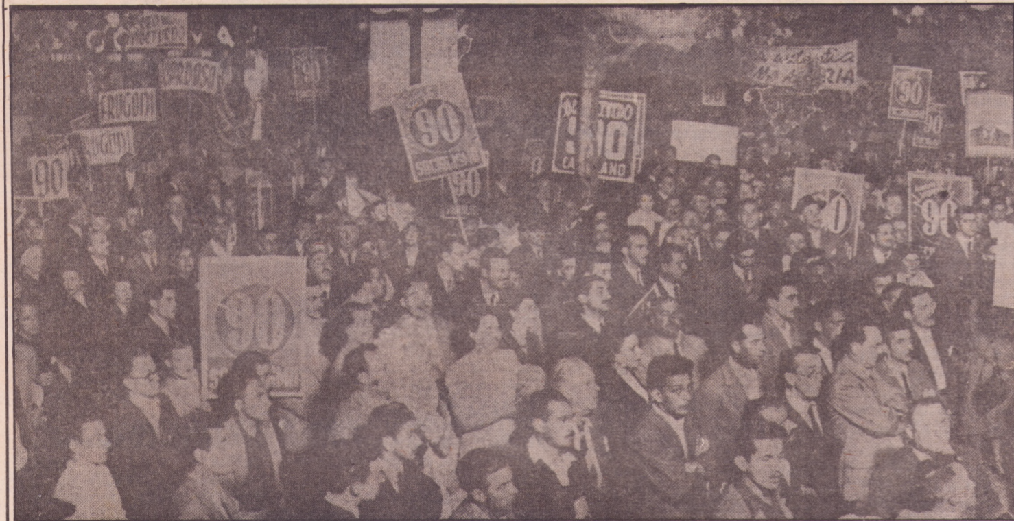
Manifestación final de la campaña electoral de 1950.

ción que ha sido atacada en todas sus formas de convivencia por la acción de 11 años de dictadura militar, exige una etapa previa centrada en la eliminación del estado autoritario, así como en la necesaria reactivación de la producción nacional.